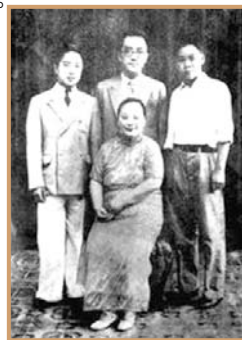
图：胡适(中)，长子胡思杜(左)；次子胡思杜(右)。

那些仍在观望的中共官员们，应该从中看到中共黑帮政治的可怕，看清中共解体的结局，退出中共，远离中共，才是最明智的自我保全之策。