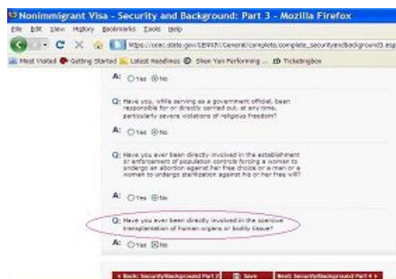
美国非移民签证申请表 DS-160 截图

1999年7月20日迫害法轮功开始时,为配合江泽民和中共对法轮功学员的迫害政策——“名誉上搞臭,经济上