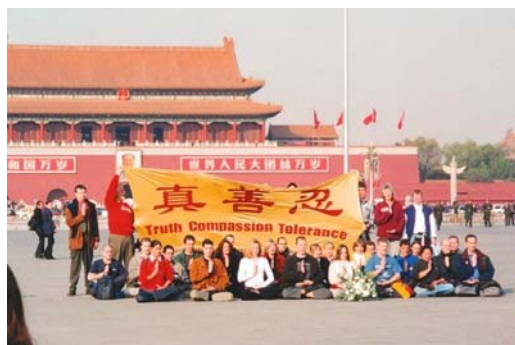
2001 年 36 位西方法轮功学员天安门请愿

法轮功修炼者身上看到了中华民族的希望！我们不能看到正义、道德、良知被践踏！不能看到好人被冤枉、被残酷的迫害，帮助他们是我们的责任！我们不应麻木、懦弱、冷血、亵渎责任！如果无辜的好人被非法审判治罪，若干年后这个荒谬的历史会让我们的后代难以理解！这将凸显了我们这个时代的自私、疯狂、急功近利，形成会有人不择手段用人血馒头邀功请赏！它还将告诉我们那些打着各种神圣名义的罪恶将得以大行其道！”