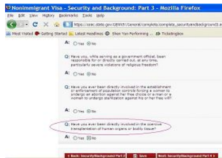
美国非移民签证申请表 DS-160 截图

1999 年 7 月 20 日迫害法轮功开始时，为配合江泽民和中共对法轮功学员的迫害政策——“名誉上搞臭，经济上截断，肉体上消灭”，法轮功被中共媒体铺天盖地的谎言抹黑、妖魔化，法轮功学员遭到肆意绑架、关押等迫害。江泽民又命令“六一零办公室”系统性地对数以千万计坚持信仰“真善忍”的中国法轮功学员实行“打