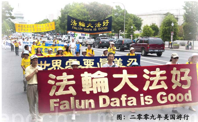
图:二零零九年美国游行

法轮功(又称法轮大法)是由李洪志先生于1992年5月13日传出的,以“真、善、忍”为根本的佛家高层次上的性命双修功法,含五套祥和舒展的功法动作。法轮功既是一种十分有效的健身功法,又是一种崇高的信仰。对“真、善、忍”的信仰,使人变得真诚、宽容与善良。法轮大法义务教功,分文不取,所有活动都是完全公开和免费的。学炼者想学就学,不想学就走,没有名册,没有组织。如今法轮大法已传播到世界上100多个国家,受到各国的褒奖达上千项,法轮大法主要著作《转法轮》,已翻译成30多种语言并可在明慧网上免费下载。