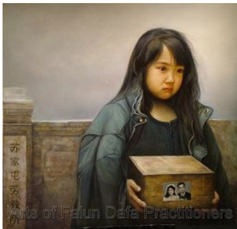
图：油画《孤儿泪》，作者：董锡强。中共的迫害造成了无数法轮功学员家破人亡。画中的孩子，父母双双被迫害致死，孩子隐忍着眼泪，捧着父母的骨灰不知何去何从……

集中体现在他对法轮功学员的迫害中。杀害的方式有两种，一种是虐杀，“打死白打死，打死算自杀，不查身源直接火化”；另一种更令人发指的罪恶，就是将法轮功学员的器官活体摘取，贩卖牟利。