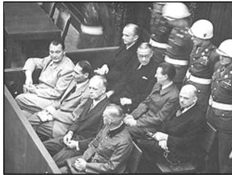
图：纽伦堡审判图片。1945年二战结束后，纽伦堡国际军事法庭否决了迫害帮凶们“奉命行事”的辩解。

二零零九年二月，由联合国推动的群体灭绝案法庭在柬埔寨首都正式开庭，以战争罪、反人类罪、酷刑及谋杀罪指控，开始对前波尔布特共