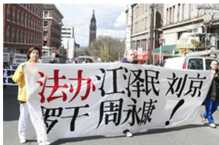
图：法轮功学员游行打出的横幅

文章强调：“法轮功学员要求法办江、罗、刘、周，正是向还在推波助澜助纣为虐者传递这样一个讯息，作恶者必须对自己的恶行负责。任何