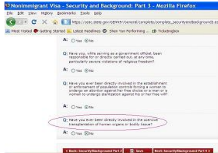
美国非移民签证申请表 DS-160 截图

学员的迫害政策——“名誉上搞臭，经济上截断，肉体上消灭”，法轮功被中共媒体铺天盖地的谎言抹黑、妖魔化，法轮功学员遭到肆意绑架、关押等迫害。江泽民又命令“六一零办公室”系统性地对数以千万计坚持信仰“真善忍”的中国法轮功学员实行“打死白打，打死算自杀”、“不查身源，直接火化”的灭绝政策。