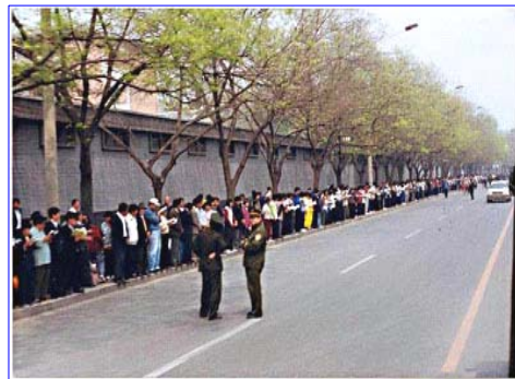
上访学员安静祥和，警察没事闲聊（注意群众身后不是紫禁城特有的红色围墙）

法轮功学员所表现出的和平理性和对正信与公义的坚守，得到了国际社会的高度评价，“4·25”上访被称作“中国上访史上规模最大、最理