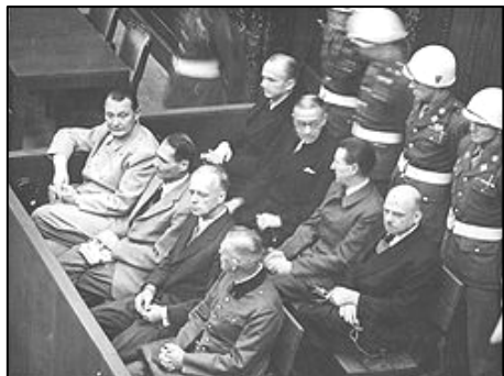
图：纽伦堡审判图片。1945年二战结束后，纽伦堡国际军事法庭否决了迫害帮凶们“奉命行事”的辩解。

二零零九年二月，由联合国推动的群体灭绝案法庭在柬埔寨首都正式开庭，以战争罪、反人类罪、酷刑及谋杀罪指控，开始对前波尔布特共