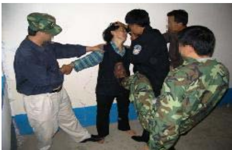
酷刑演示：拳打脚踢

恶徒对男法轮功学员更残忍，强迫一位法轮功学员举汽车轱辘上的铁瓦过头顶，上面还压上几块砖，让他跑步，跑慢了恶人就用脚踹，还用了一个三十多公分长的铁棒子打。另外还把大法弟子四肢抬起象砸坑一样墩上墩下，连续几天的折磨，每个法轮功学员都被打的几天起不了床，脱不了衣服和鞋袜。法轮功学员被害成这样，他们还嘲讽地说：一个个好象