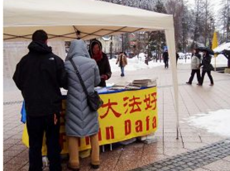
图：德国缇缇湖畔的真相信息台

有游客说，我们知道天安门自焚案是假的，过去不敢说。现在连网上都能搜索出来了，还见到活摘（法轮功学员）器官的消息，看来江泽民是不行了。形势好转，希望能越来越好。你们法轮功（学员）能回去了，盼着你们快回去，早日回家啊！