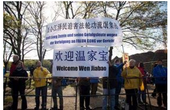
图：法轮功学员打出横幅传递重要信息

【明慧网】今年德国汉诺威工业展的合作伙伴是中国。二零一二年四月二十二日，中国总理温家宝和德国总理默克尔为这个国际最大的工业展揭幕。