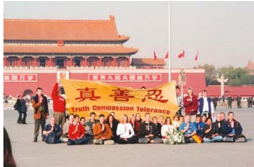
2001 年 36 位西方法轮功学员天安门请愿

法轮功修炼者身上看到了中华民族的希望! 我们不能看到正义、道德、良知被践踏! 不能看到好人被冤枉、被残酷的迫害, 帮助他们是我们的责任! 我们不应麻木、懦弱、冷血、亵渎责任! 如果无辜的好人被非法审判治罪, 若干年后这个荒谬的历史会让我们的后代难以理解! 这将凸显了我们这个时代的自私、疯狂、急功近利, 形成会有人不择手段用人血馒头邀功请赏! 它还将告诉我们那些打着各种神圣名义的罪恶将得以大行其道!”