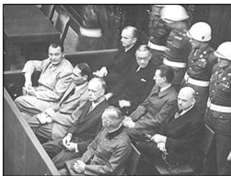
图：纽伦堡审判图片。1945年二战结束后，纽伦堡国际军事法庭否决了迫害帮凶们“奉命行事”的辩解。

二零零九年二月，由联合国推动的群体灭绝案法庭在柬埔寨首都正式开庭，以战争罪、反人类罪、酷刑及谋杀罪指控，开始对前波尔布特共产