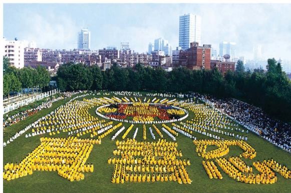
一九九七年武汉五千多名法轮功学员列队组字

居委会人员说:你是有钱,但有钱的人也不一定有善心啊,现今像你这样的人太少了!她说:我不是患得患失,是我师父教我这样做的。第二天她不在家,居委会人员把喜报贴在她家门口。