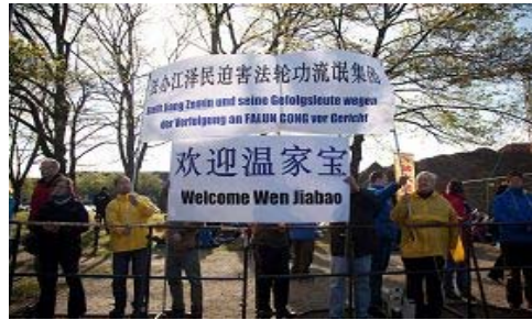
▲法轮功学员打出横幅传递重要信息

来自德国、丹麦、瑞士等国的法轮功学员先后在汉诺威市中心和会议中心前以及在德国总理默克尔宴请温家宝的饭店前举行了一系列活动,抗议中共迫害法轮功学员,要求法办迫害法轮功的元凶江泽民流氓集团,希望中国民众能够认清中共流氓本质,从内心抛弃中共,也希望中共内尚有良知的官员能够明辨是非,共同清算江氏流氓集团对法轮功欠下的血债,为自己和中华民族的未来积下善德。