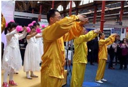
法轮功学员们展示功法

人们从观看者，变成了参与者，每次法轮功学员功法演示之后，都有很多的人当场跟着学起