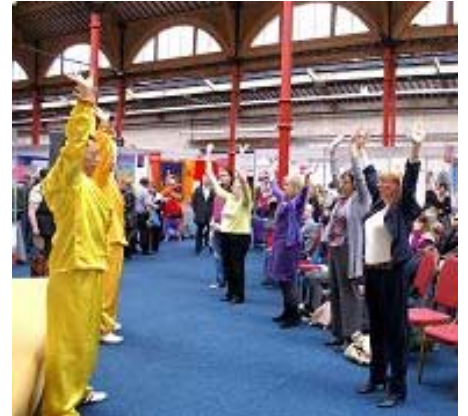
观看的民众和学员们一起炼功

一位年长的爱尔兰女士，多年前曾经看过法轮功的书，但是不会炼动作，所以没有坚持下去，这次又看见法轮功的展位，非常高兴，当即表示要学习动作，但是城里的教功班对她来说太远，学员很热情地说可以去她住的地方教她，她很感激，留了联系