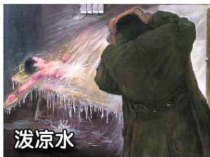
法轮功学员遭受的部分酷刑

【明慧网】原河北省第四监狱（北郊监狱）和石家庄监狱（第二监狱）合并称石家庄监狱。自1999年中共迫害法轮功以来成为中共所谓“转化”法轮功学员的基地，利用各种酷刑手段迫害善良的法轮功学员，罪恶累累。