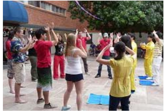
亚利桑那大学学生们踊跃学炼法轮功

待法轮功学员每年都能去教授功法。法轮功学员们也很高兴让越来越多的人了解真相, 传播“真、善、忍”的美好福音。◇