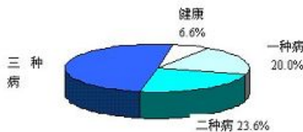
图2 炼功前健康状况分布

一九九八年国家体育总局组织北京、武汉、大连及广东省的医学专家,对近三万五千名法轮功学员做了五次医学调查,证明了法轮功祛病健身有效率高于百分之九十八。同时,以乔石为首的老干部也做了详尽调查,得出“法轮功于国于民有百利而无一害”的结论。