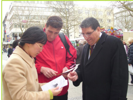
巴勒斯坦的世乒赛球员在听真相

德国多特蒙德市是一座体育名城，今年是第三次举办世乒赛，迎来了六万名来自超过一百四十个国家的参与者。世乒赛期间，很多国家的民众通过法轮功学员了解到，中国除了乒乓球有名外，更有一种气功受到欢迎，在中国曾有一亿人修炼，如今