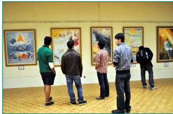
■在温哥华卑诗省大学亚洲研究中心举行的真善忍美展吸引了很多大学师生来参观

展览。在中共媒体的造谣污蔑下，许多世人对法轮功有误解，也不知道迫害的严峻，更不知修炼者在逆境中坚守“真善忍”的许多可歌可泣的故事。画家们以亲身体会和所见所闻，以画笔和巧思如实地表现，让世人正确认识法轮功和当前正在中国发生的迫害。真善忍美展自二零零四年以来，在全球二百多个城市展出，赢得民众的欢迎与喜爱。◇