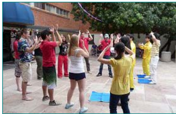
■亚利桑那大学学生们踊跃学炼法轮功