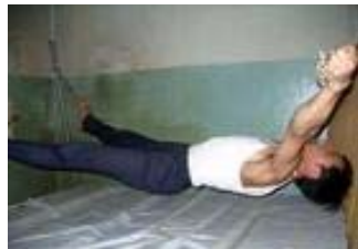
酷刑迫害演示图“抽筋”

“长时间罚蹲”是马三家教养院强制“转化”威逼、折磨法轮功学员的常用酷刑，脚后跟靠拢，蹲着身体不准动，造成双脚、腿、胯麻痛，后背、颈酸痛，非常痛苦。