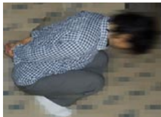
酷刑迫害演示图“罚蹲”

“抽筋”是马三家教养院对法轮功学员最残酷的迫害之一，邪恶之徒把不放弃修炼的大法学员的四肢固定在床上，把手脚固定，然后上劲，这时身体悬空，四肢抻开；再上劲，几秒钟人就昏死过去；十几分钟四肢筋骨皮肉全部离位，从此人就残废了。