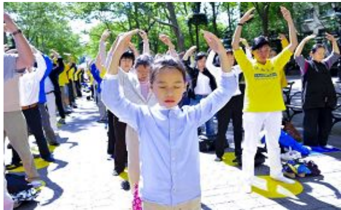
法轮功学员在联合国大厦前的哈玛绍广场集体炼功