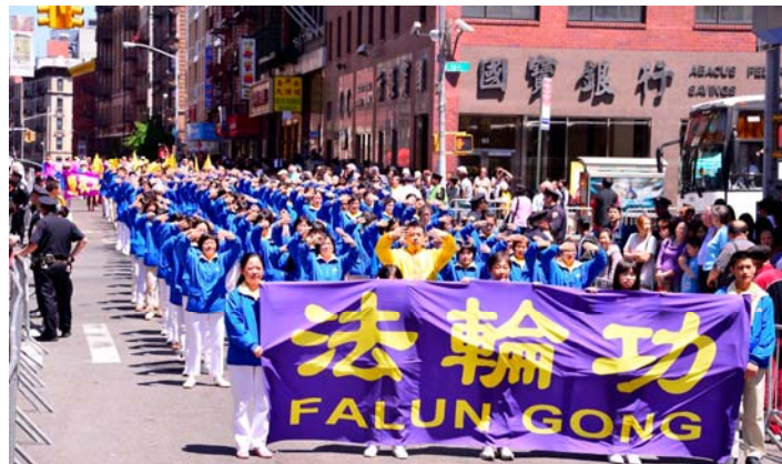
纽约 7000 人的浩大游行队伍