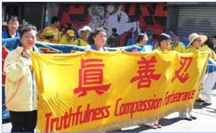
纽约七千人大游行庆大法弘传 20 周年