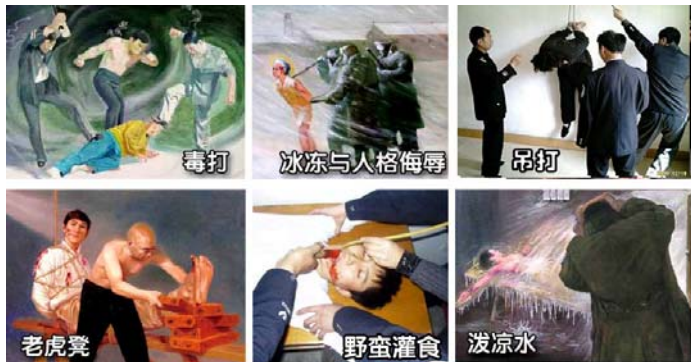
法轮功学员遭受的部分酷刑

名义上“六一零”是政府下属的一个办公室，可它并不是隶行政府职能的机构，干的是非法限定人身自由、劫持关押公民、指挥公安、安全局监听、监控、秘密绑架法轮功学员，干涉法律公正、强制洗脑、实施暴力、非法入侵民宅、策划恐怖行为、制造谎言、任意胡作非为、自立土政策，执有生杀大权。它既不隶政，建树政绩，它又超越宪法，取代法律，害民害国，是地地道道的非法组织。