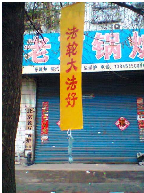
左上：河南省“天灾中共 三退保命” 左下：黑龙江牡丹江市“法办周永康” 中上：黑龙江牡丹江市“法轮大法好” 右上：东北某市城乡“普天同庆法轮大法弘传二十周年” 右下：广东梅州“世界需要真善忍”