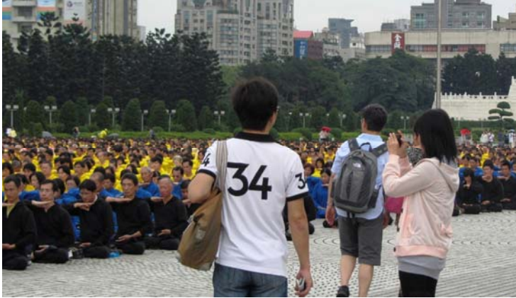
上图：大陆及来自各地的游客为场中七千多名学员的盛大场面所吸引，有的拿起相机拍照留念。下图：大炼功