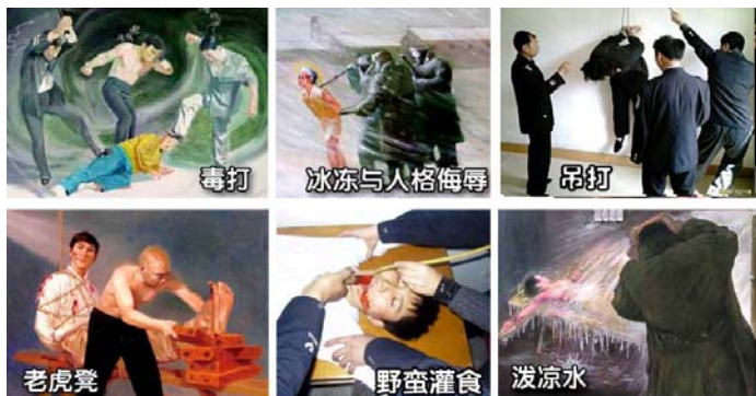
法轮功学员遭受的部分酷刑

名义上“610”是政府下属的一个办公室，可它并不是隶行政府职能的机构，干的是非法限定人身自由、劫持关押公民、指挥公安、安全局监听、监控、秘密绑架法轮功学员，干涉法律公正、强制洗脑、实施暴力、非法入侵民宅、策划恐怖行为、制造谎言、任意胡作非为、自立土政策，执有生杀大权。它既不隶政，建树政绩，它又超越宪法，取代法律，害民害国，是地地道道的非法组织。