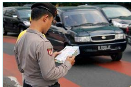
■现场维持秩序的工作人员阅读法轮功真相资料