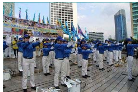
■雅加达天国乐团演示法轮功功法