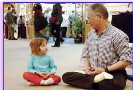
图：善良无罪，修炼无罪。