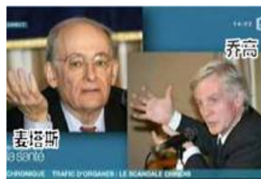
图：2010 年 1 月 7 日，收视率很高的法国电视 5 台专题报道，揭露中共活体摘取大量法轮功学员器官进行贩卖的罪行。

加拿大前亚太司司长大卫·乔高和人权律师大卫·麦塔斯组成独立调查组，他们经过了两个多月取得五十多个证据，于 2006 年 7 月 6 日公开了一份关于“中共活体摘取法轮功学员器官”的调查报告，结论是：从 2000 年开始，活体摘取法轮功学员器官贩卖牟利的系统犯罪