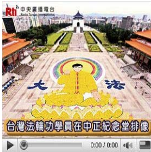
台湾法轮功学员在中正纪念堂排像

台湾社会广泛的知道法轮功这个修炼团体, 是从一九九九年中共政权打压法轮功的时候开始的。经过十三年来的努力, 法轮功在台湾不但已经摆脱中共官方宣传的丑化, 学习和修炼的人数持续增长, 而且成为领导