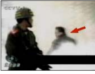
4、击打者仍保持用力姿势

“610”是江泽民集团迫害法轮功的最高权力机构和最有力的政治恐怖工具，其唯一职能就是迫害法轮功，是负责组织、策划、密谋、实施迫害法轮功的总指挥部，该机构成立于1999年6月10日，故称“610办公室”，简称“610”。