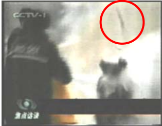
2、击打后飞出的重物