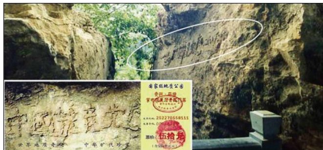
大图为“藏字石”的断裂面，小图为风景区的门票，国内媒体只报了前面的五个字，不敢报最后的“亡”字。

天网恢恢，善恶分明；苦海有边，生死一念。曾被历史上最邪恶的魔教所欺骗的人，曾被邪恶打上兽的印记的人，请抓住这稍纵即逝的良机。”