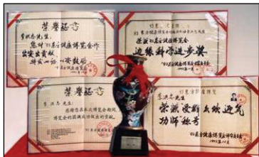
图：93年东方健康博览会最高奖

使人健康 1998年，国家体总在北京、武汉、大连地区及广东省进行了五次医学调查，调查人数近三万五千人。调查结果显示修