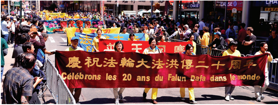
图：二零一二年五月十二日，纽约七千人游行庆大法弘传二十周年。