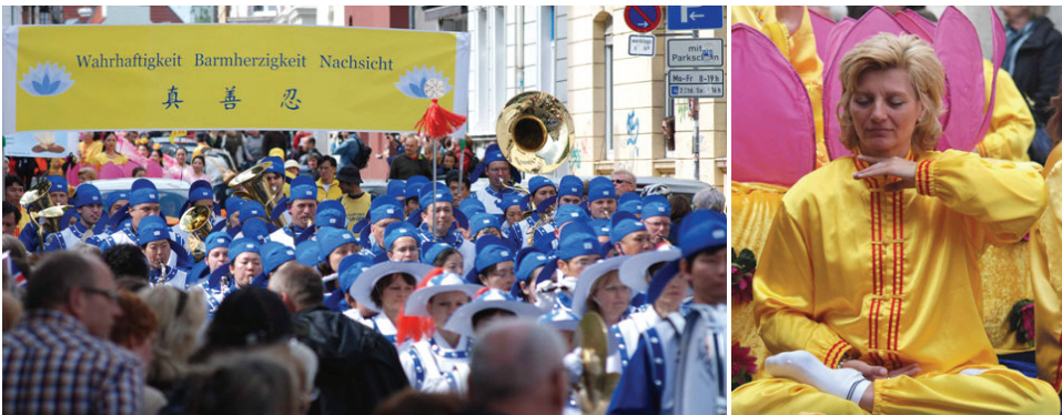
左图：由法轮功学员组成的欧洲天国乐团。 右图：演示法轮功第五套功法。

当今世界，国际社会分歧最大的恐怕就是各自的政治观点。然而从非洲、东欧到拉丁美洲、北美，从韩国、日本到俄罗斯、冰岛，国际社会各界对于法轮大法的广泛支持和褒奖，正说明法轮大法不但超越种族与文化的界限，并且与政治无缘。实际上，“真、善、忍”也是全人类的精神财富。来自中国的法轮功洪传世界各地，正是每一个炎黄子孙的骄傲。