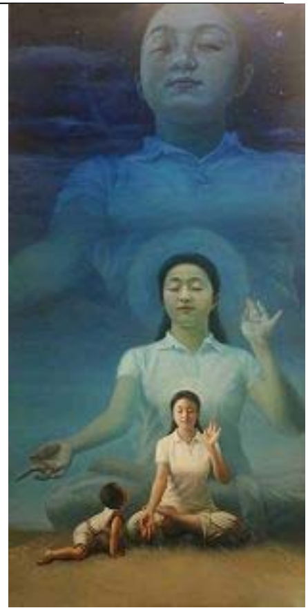
图：第三届“全世界华人人物写实油画大赛”获金奖的画作《眼里的妈妈（又名纯净入仙境）》（作者：美国画家陈肖平）