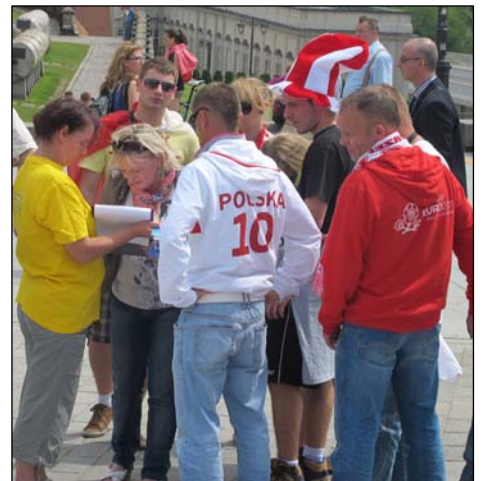
游客和各国球迷签名反对中共迫害

◎二零零零年的腊月，湖北浠水某地，几天大雨使清港的泥巴堵塞了通向集市的要道，无法通行，但没有人管。一位七十多岁的法轮功学员看到后，自己拿来铁锹，一锹锹地将泥巴挪到港边的岸上，干得大冬天脱了棉衣还浑身是汗。（接下页）