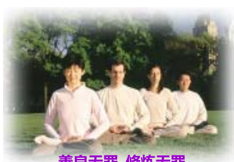
善良无罪 修炼无罪