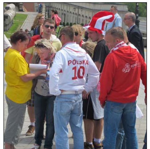
游客和各国球迷签名反对中共迫害

◎二零零零年的腊月，湖北浠水某地，几天大雨使清港的泥巴堵塞了通向集市的要道，无法通行，但没有人管。一位七十多岁的法轮功学员看到后，自己拿来铁锹，一锹锹地将泥巴挪到港边的岸上，干得大冬天脱了棉衣还浑身是汗。（接下页）