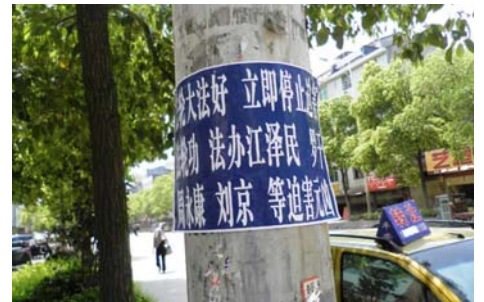
大陆出现法办迫害元凶条幅、不干胶