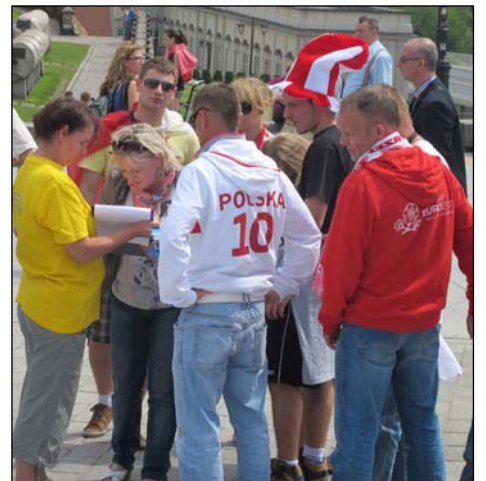
游客和各国球迷签名反对中共迫害

◎二零零零年的腊月，湖北浠水某地，几天大雨使清港的泥巴堵塞了通向集市的要道，无法通行，但没有人管。一位七十多岁的法轮功学员看到后，自己拿来铁锹，一锹锹地将泥巴挪到港边的岸上，干得大冬天脱了棉衣还浑身是汗。（接下页）