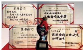
1993年北京东方健康博览会上，李洪志先生获“边缘科学进步奖”和“受群众欢迎气功师”

● 福益社会 1998年下半年，前人大退休老干部对法轮功进行了数月的调查，得出“法轮功于国于民有百利而无一害”的结论，并于年底向中央政治局提交了调查报告。