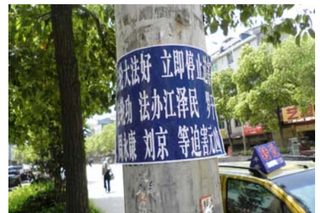
大陆出现法办迫害元凶条幅、不干胶