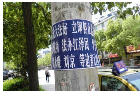
大陆出现法办迫害元凶条幅、不干胶

在车间干活，活儿不多时一般晚上十点收工，活儿多时十一点半以后，甚至收工回到宿舍后继续做，有时到下半夜一、两点，无论多晚，第二天早上照常六点以前起床出工。