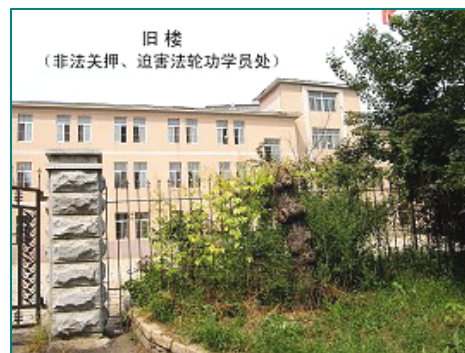
旧楼被很高的带尖铁栅栏封闭成一个内院，窗户都被铁栅栏封死，一切都是为非法关押设计。

洗脑基地还有一个强盗逻辑：明明是他们在非法拘禁、迫害法轮功学员，拆散家庭，却反复劝导法轮功学员“要为家人考虑”、“早点转化回去”等等，在这里“亲情”已成为胁迫转化的工具。如果不奏效，就反过来指