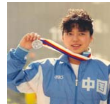
전 올림픽 수영 명장 황소민