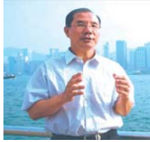
전 산서과학기술 협회 비서장 가잡