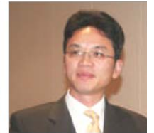
전 시드니주재 외교관 진용림