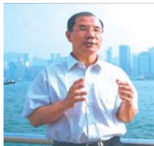
전 산서과학기술 협회 비서장 가잡