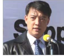
전천진 610 관원 호봉군