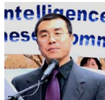
전 국가안전부 대 외 정보관 리봉지