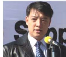
전천진 610 관원 호봉군