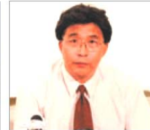
전 심양시 사법국 국장 한광생