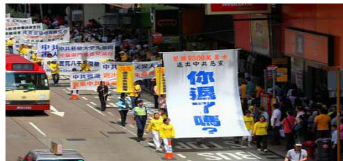
그림: 2011년 4월 24일 홍콩에서 9300 만 탈당대조를 성원

호함과 뒤섞여 분명하지 않은 현상은 매개 사람의 지혜와 오성을 검증하고 있다. 어떤 선택을 하는가는 각자의 미래에 결정적인 작용을 하고 있다.