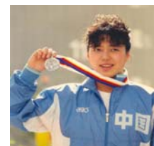
전 올림픽 수영 명장 황소민