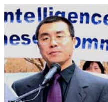
전 국가안전부 대 외 정보관 리봉지