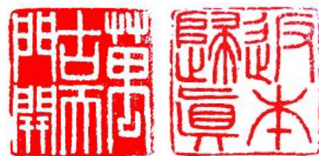
篆刻：万古天门开、返本归真

我凭着一颗人的良心，年复一年，日复一日，把大法真相材料、小册子、光盘等，送到千家万户。希望人们不被谎言欺骗，有一个美好的未来。（文／沈阳大法弟子 朝真）◇