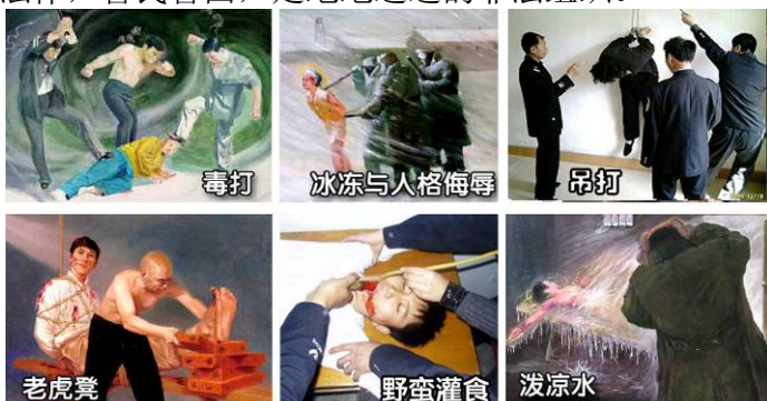
法轮功学员遭受的部分酷刑

名义上“610”是政府下属的一个办公室，可它并不是隶行政府职能的机构，干的是非法限定人身自由、劫持关押公民、指挥公安、安全局监听、监控、秘密绑架法轮功学员，干涉法律公正、强制洗脑、实施暴力、非法入侵民宅、策划恐怖行为、制造谎言、任意胡作非为、自立土政策，执有生杀大权。它既不隶政，建树政绩，它又超越宪法，取代法律，害民害国，是地地道道的非法组织。