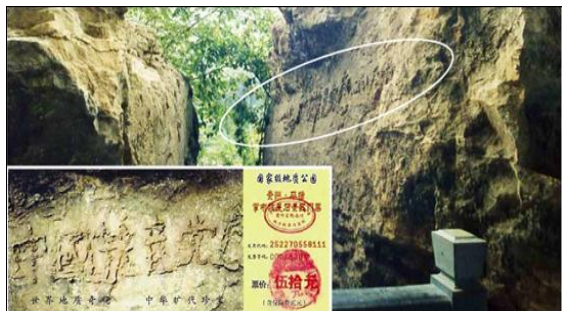
大图为“藏字石”的断裂面, 小图为风景区的门票, 国内媒体只报了前面的五个字, 不敢报最后的“亡”字。

2002年6月, 在贵州省平塘县掌布乡发现一块巨石, 石面上有排列整齐的六个大字: “中国共产党亡”。经三路专家前往考察, 这块巨石距今已有2亿7千万年, 500年前从高崖上落下来, 断成两块, 字在右边那块巨石上, 清晰可辨。又经鉴定, 这些字都是天然形成的, 没有任何人为加工的痕迹。当时国内一百多家媒体包括新华社、中央台都有过报道与专题, 网上也能搜索到相关照片, 当然, 它们都不敢提最后那个字, 但从照片上可以看出来。千百年来, 在中国, 在要出大事之前