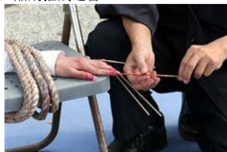
酷刑演示：竹签扎手指

暴打：用胶棒、棍子、木板子、等工具毒打；竹签、钢针扎学员的指甲缝、身体；用牙刷在嘴里肆意戳拌；强逼罚站；夏天吊在酷暑的烈日下曝晒、冬天吊或站在冰天雪地里冻、手铐铐、关禁闭室、关小号、抽耳光、“飞燕老虎凳”（恶人说：‘燕飞老虎凳’转化很容易，最多五分钟，让你干什么就干什么）、多根电棍电击、酷刑开飞机、上绳、老虎凳、侮辱人格（当孝子）、威胁、恐吓、谩骂、逼迫下跪、在炎热的太阳地跪着曝晒（一跪就是五、六个小时乃至更多时间）、往脸上画侮辱人格的漫画、打毒针、用钳子拔牙、拧