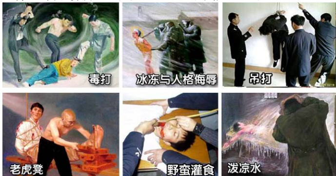
法轮功学员遭受的部分酷刑

名义上“610”是政府下属的一个办公室，可它并不是隶行政府职能的机构，干的是非法限定人身自由、劫持关押公民、指挥公安、安全局监听、监控、秘密绑架法轮功学员，干涉法律公正、强制洗脑、实施暴力、非法入侵民宅、策划恐怖行为、制造谎言、任意胡作非为、自立土政策，执有生杀大权。它既不隶政，建树政绩，它又超越宪法，取代法律，害民害国，是地地道道的非法组织。