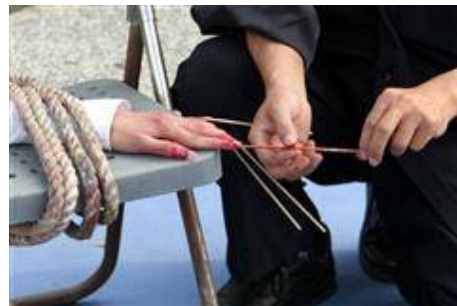
酷刑演示：竹签扎手指

暴打：用胶棒、棍子、木板子、等工具毒打；竹签、钢针扎学员的指甲缝、身体；用牙刷在嘴里肆意戳拌；强逼罚站；夏天吊在酷暑的烈日下曝晒、冬天吊或站在冰天雪地里冻、手铐铐、关禁闭室、关小号、抽耳光、“飞燕老虎凳”（恶人说：‘燕飞老虎凳’转化很容易，最多五分钟，让你干什么就干什么）、多根电棍电击、酷刑开飞机、上绳、老虎凳、侮辱人格（当孝子）、威胁、恐吓、谩骂、逼迫下跪、在炎热的太阳地跪着曝晒（一跪就是五、六个小时乃至更多时间）、往脸上画侮辱人格的漫画、打毒针、用钳子拔牙、拧