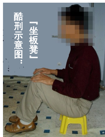
酷刑示意图: 「坐板凳」