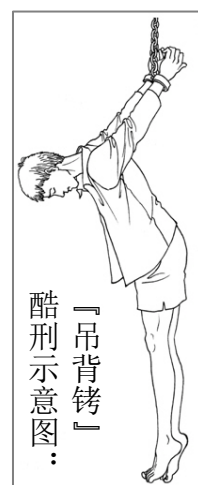
酷刑示意图: 「吊背铐」