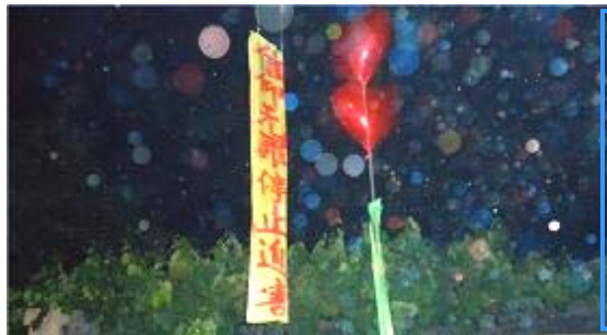
气球真相 漫天真相 天五颜六色 颜六色法轮 惊

有一天，厂子里的一名中层干部对我说：“厂长开干部会时提你们法轮功来着。”说：“你们都能象学法轮功的人一样，我这个厂长就好干了！”我笑了。