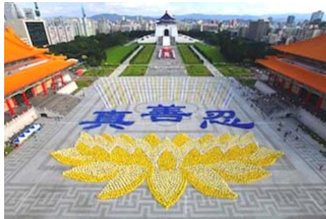
图：2010 年 11 月约 6000 名法轮功学员在台湾排出莲花图形与“真善忍”。

“真、善、忍”真正地唤起了人们心中的佛性，即使在遭受迫害的十多年中，法轮功学员在自身遭受巨大苦难的同时，始终坚持和平反迫害，向民众讲清真相，实践着“真、善、忍”。