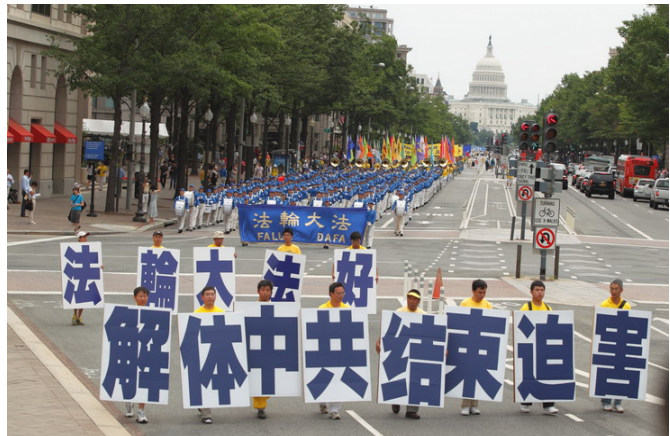
浩浩荡荡的游行队伍