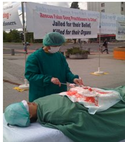
在国际器官移植会议开会地点前，法轮功学员模拟演示中共活摘器官。