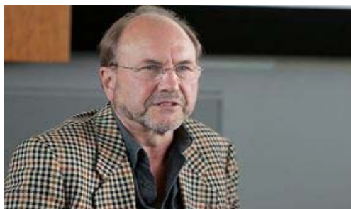
来自瑞士的施瓦茨表示，西方制药公司卷入了活摘器官罪行。

因为施瓦茨曾作为计算机专业人士在医院工作多年，所以他精通医学文献搜索。这项优势在他调查西方制药公司是否也卷入活摘器官的罪行时帮了大忙。