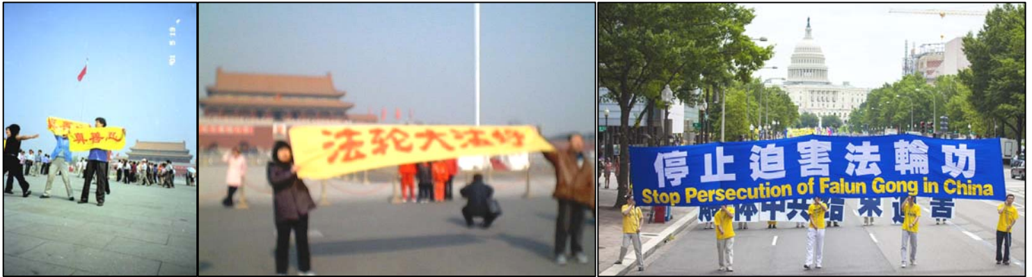
左图：法轮功学员在天安门广场展示横幅和平请愿；右图：二零一二年七月十三日，来自欧、美、亚、澳等地的三千多名法轮功学员汇集美国首都华盛顿 DC 举行游行集会，抗议中共迄今长达十三年的惨无人道的迫害。

【明慧网】一九九九年七月二十日中共江氏集团动用整部国家机器迫害法轮功，动用一切媒体、司法、军警、特务、党政、外交，进行全方位的迫害，对法轮功学员非法关押、洗脑、毒打、电刑、性侵害、强行注射破坏中枢神经药物，乃至活摘器官，惨无人道的迫害手段令人发指。迄今至少有三千五百名法轮功学员被迫害致死的案例被证实，难以计数的无辜公民被绑架进看守所、劳教所、监狱、洗脑班与精神病院，被迫害致伤残、失学、失业、流离失所、家破人亡。