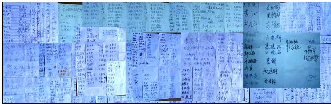
图：唐山、秦皇岛支持营救郑祥星的更多民众签名，人数 1201 人。