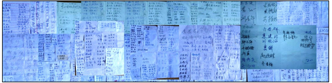
图：唐山、秦皇岛支持营救郑祥星的更多民众签名，人数 1201 人。