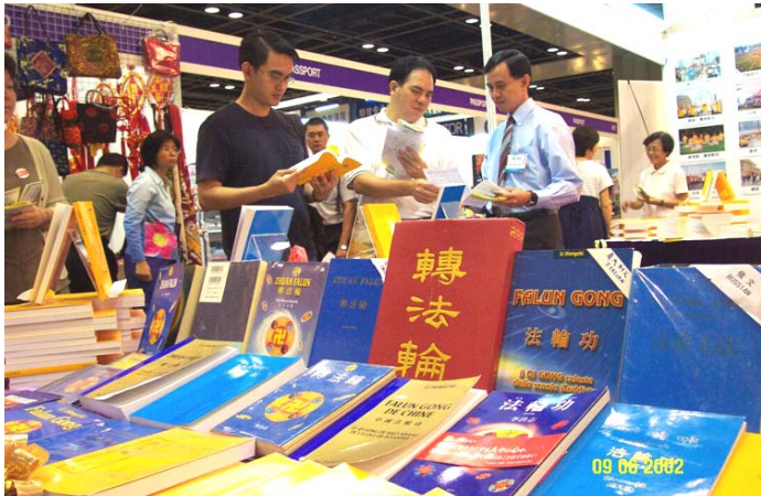
新加坡世界书展中的各语种法轮功书籍。(2002年6月)

1998年下半年，以乔石为首的部分全国人大离退休老干部，对法轮功进行了详细调查、研究，得出“法轮功于国于民有百利而无一害”的结论，并于年底向江泽民为首的政治局提交了调查报告。这也是在职及离休的中共二百名以上高级干部几次致中共中央联名信反复申说的话。中央政治局七个常委中的六个都反对迫害法轮功。