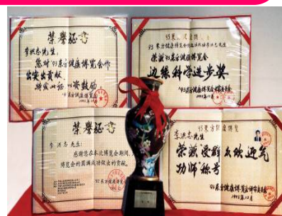
1993年北京健康博览会上，李洪志先生获“边缘科学进步奖”和“受群众欢迎气功师”称号。

● 法轮大法弘传世界 法轮功至今已弘传一百多个国家和地区（包括台湾、香港、澳门），法轮功的书籍被译成30多种语言出版发行，并可在互联网上免费下载。“真善忍”的信仰得到了各族裔民众的爱戴和尊敬，却在中國大陸一地受到残酷迫害。