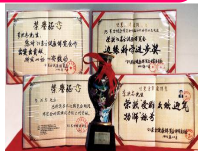
1993年北京健康博览会上，李洪志先生获“边缘科学进步奖”和“受群众欢迎气功师”称号。

● 法轮大法弘传世界 法轮功至今已弘传一百多个国家和地区（包括台湾、香港、澳门），法轮功的书籍被译成30多种语言出版发行，并可在互联网上免费下载。“真善忍”的信仰得到了各族裔民众的爱戴和尊敬，却在中國大陸一地受到残酷迫害。