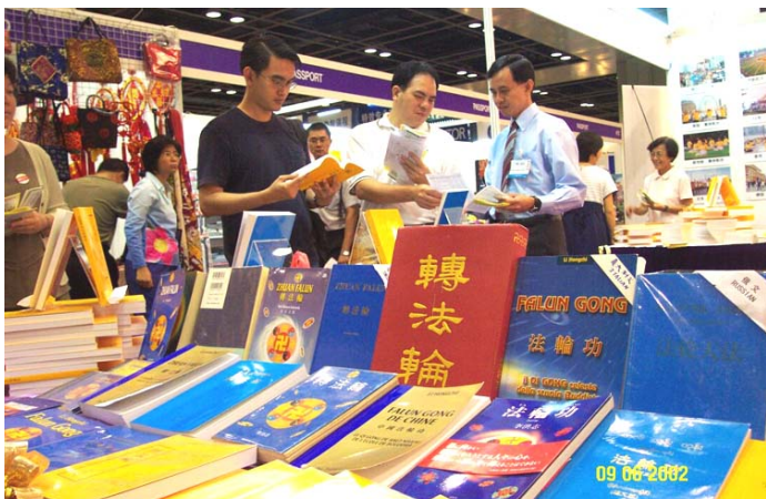
新加坡世界书展中的各语种法轮功书籍。(2002年6月)

1998年下半年，以乔石为首的部分全国人大离退休老干部，对法轮功进行了详细调查、研究，得出“法轮功于国于民有百利而无一害”的结论，并于年底向江泽民为首的政治局提交了调查报告。这也是在职及离休的中共二百名以上高级干部几次致中共中央联名信反复申说的话。中央政治局七个常委中的六个都反对迫害法轮功。