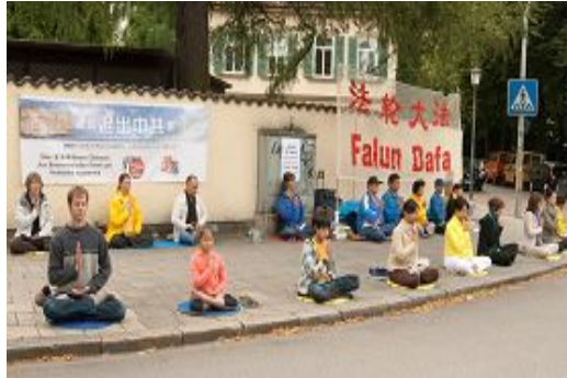
法轮功学员在慕尼黑中领馆前和平抗议中共迫害

从一九九二年法轮功传出到一九九九年七月迫害开始，中国有上亿人在修炼法轮功。据明慧网报道，在中共对法轮功十三年的迫害中，至少有三千五百多名法轮功学员被迫害致死，由于信息封锁，这数字还仅是实际情况的冰山一角，被揭露出更为惨烈的是中共对法轮功学员实行的